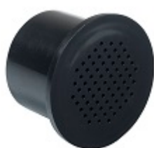
Filtre à charbon actif - FILTRE1 Il est recommandé de le changer tous les ans.